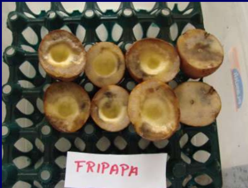
Foto 9. Variedad Susceptible referencial