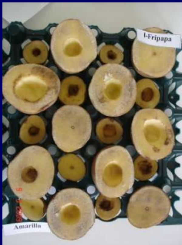
Foto 2. Lesiones en las variedades Amarilla (referencial NKD) (pequeñas) e I-Fripapa (grandes) categorizadas como moderadamente resistente y susceptible respectivamente.