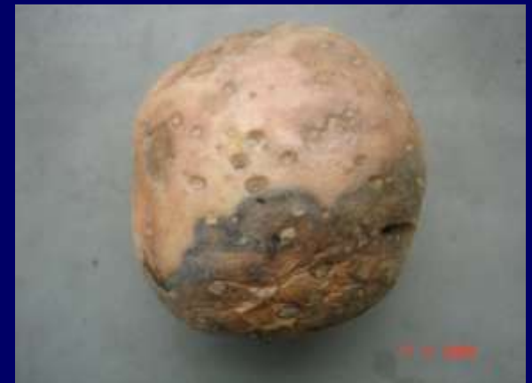
Tubérculo con pudrición