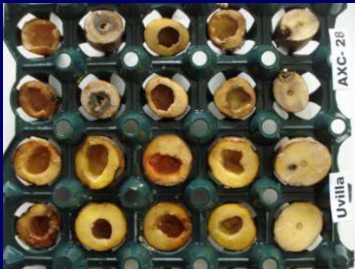
Foto 6. Lesiones en las variedades Uvilla y Ch. ratona (susceptibles).