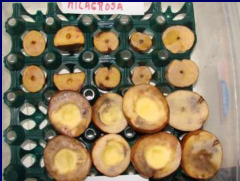
Foto 4. Lesiones en la variedad Milagrosa (resistente) y la variedad I- Fripapa (susceptible).