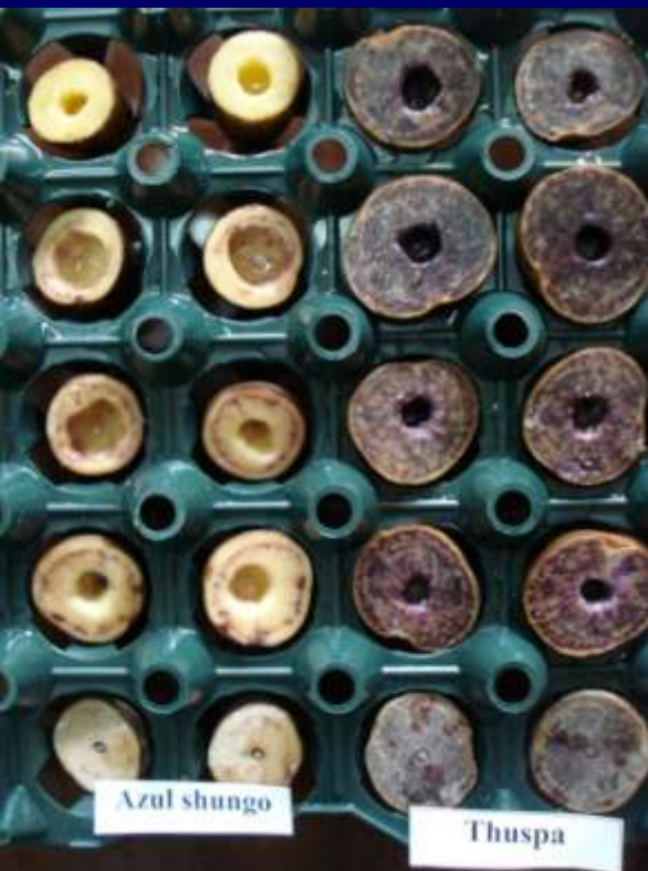
Foto 1. Lesiones en las variedades nativas, Azul shungo y Tushpa, categorizadas como resistentes.