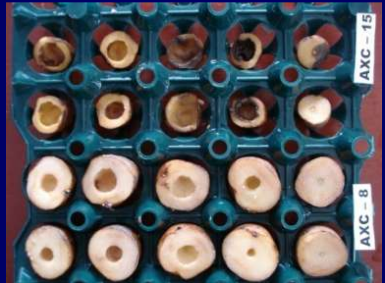
Foto 5. Lesiones en las variedades Ch. Amarilla 2 y Ch. botella (susceptibles).