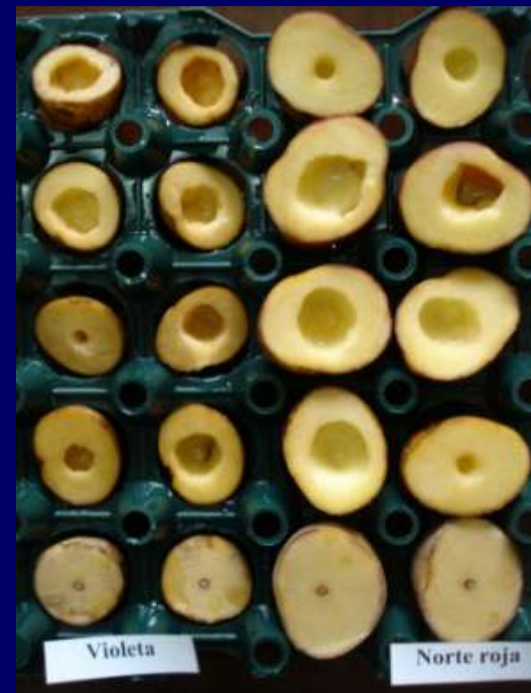
Foto 3. Lesiones en las variedades nativas Norte roja (der.) y Violeta (izq.) categorizadas como susceptibles.